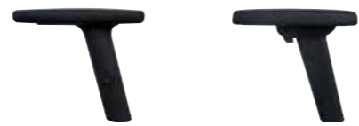
Brazo 2D en 2382-6 y 2384-8 Brazo 4D + 15,00 € sobre 2D